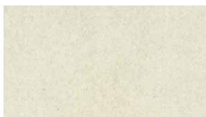
B201 - Weiß

Es werden Farbpigmente dem Zement beigemischt. Die Farbintensität wird durch klimatische Gegebenheiten beeinflusst. Temperaturen und Luftfeuchte können zu unterschiedlichen Trocknungszeiten führen ( in der Regel 6 - 8 Wochen). Der Beton erhält dadurch immer eine unterschiedliche und lebhaft Wolkenbildung .