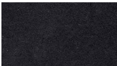
B204 - Schwarz

Sonderfarbtöne sind auf Anfrage ebenfalls erhältlich! Der Beton kann ebenfalls nach RAL-Ton eingefärbt werden!