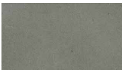
B101 - Grau