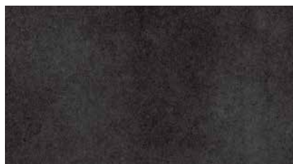
B204 - Anthrazit