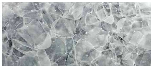
GK-203 Ice Nugget, pure / matt / poliert