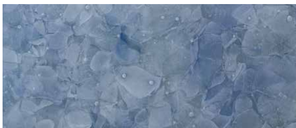
GK-401 Sky Blue, pure / matt / poliert