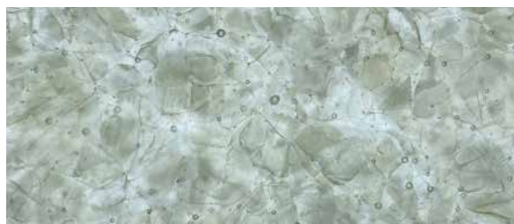
GK-402 Stormy Grey, pure / matt / poliert