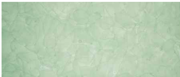
GK-101 Jade Green, pure / matt / poliert