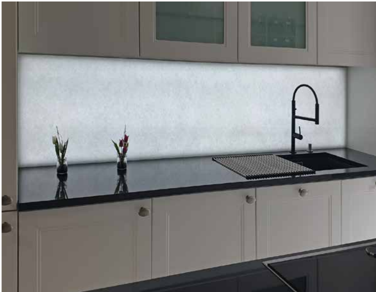
Polar White mit LED Paneel beleuchtet