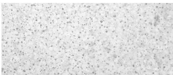
GK-103 Raindrop Clear, pure