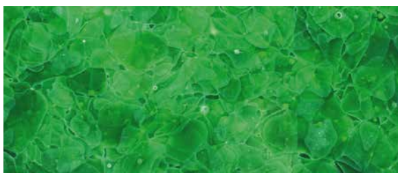
GK-202 Forest Green, pure / matt / poliert