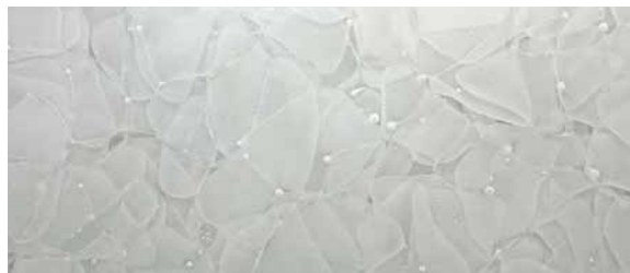
GK-102 Polar White, pure / matt / poliert