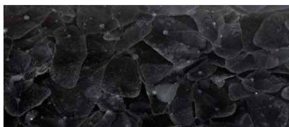
GK-301 Pearl Black, pure / matt / poliert